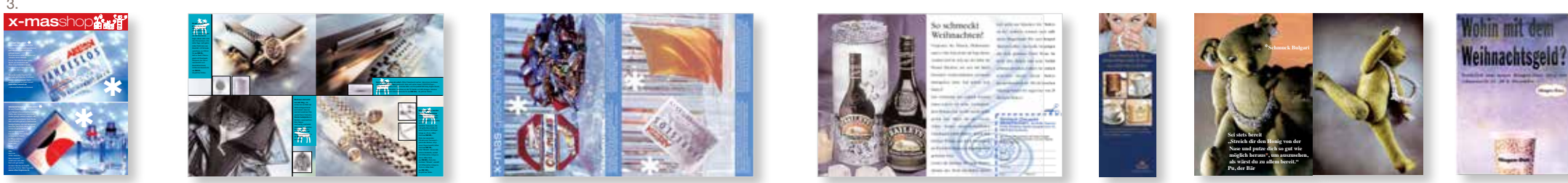
3. X-mas L: Anzeigenstrecke | Auftraggeber: Brigitte, Gruner + Jahr | Leistung: ein Design für viele Kunden, Texte