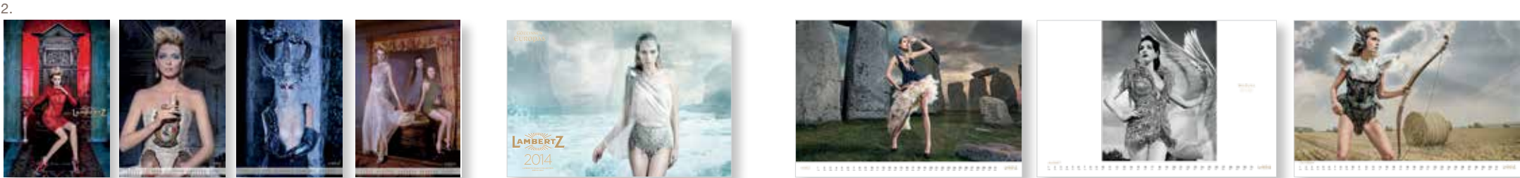
2. X-mas XL: Lambertz-Kalender 2013 und 2014 | Zielgruppe: Top Kunden | Auftraggeber: Achener Printen- und Schokoladenfabrik | Leistung: Layout, Vorwort, Drucküberwachung