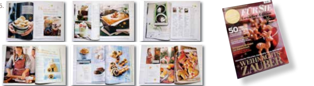
5. X-mas L: Bookazine | Auftraggeber: Special für die FÜR SIE, Jahreszeiten-Verlag | Leistung: Bild-Konzept, Layout