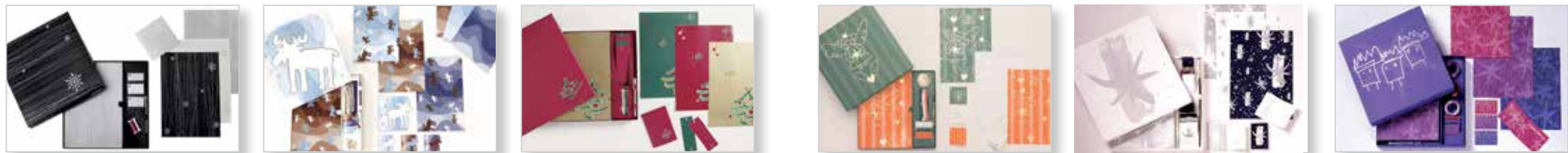
1. X-mas XXL: Weihnachtspackage – Karton mit Weihnachtspapier, Geschenkband und Grußkarten | Zielgruppe: Premium-Kunden | Auftraggeber: Brigitte, Gruner + Jahr | Leistung: Illustrationen und Design, Papierauswahl, Drucküberwachung