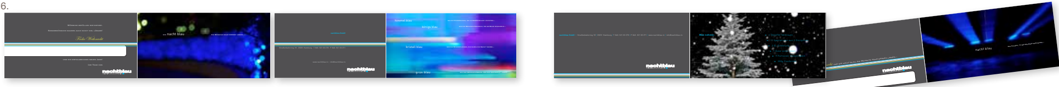
6. X-mas S: Weihnachtskarte | Zielgruppe: Geschäftspartner | Auftraggeber: nachtblau, TV-Produktion | Leistung: Konzept, Design, Text